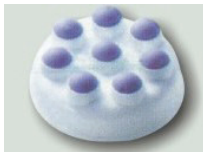
Nastavak sa kuglicama