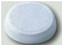
Mikrošmirgla za pete